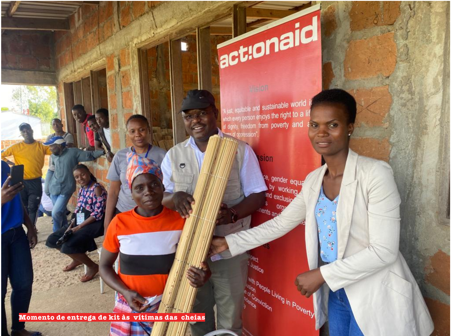
Momento de entrega de kit às vítimas das cheias

A Associação ActionAid Moçambique (AAMoz) através do Núcleo Académico para o Desenvolvimento da Comunidade (NADEC), entregou no início deste mês, nos postos administrativos 3 de Fevereiro e Xinavane no distrito da Manhica, província de Maputo, kits de dignidade e material escolar para as vítimas das cheias.