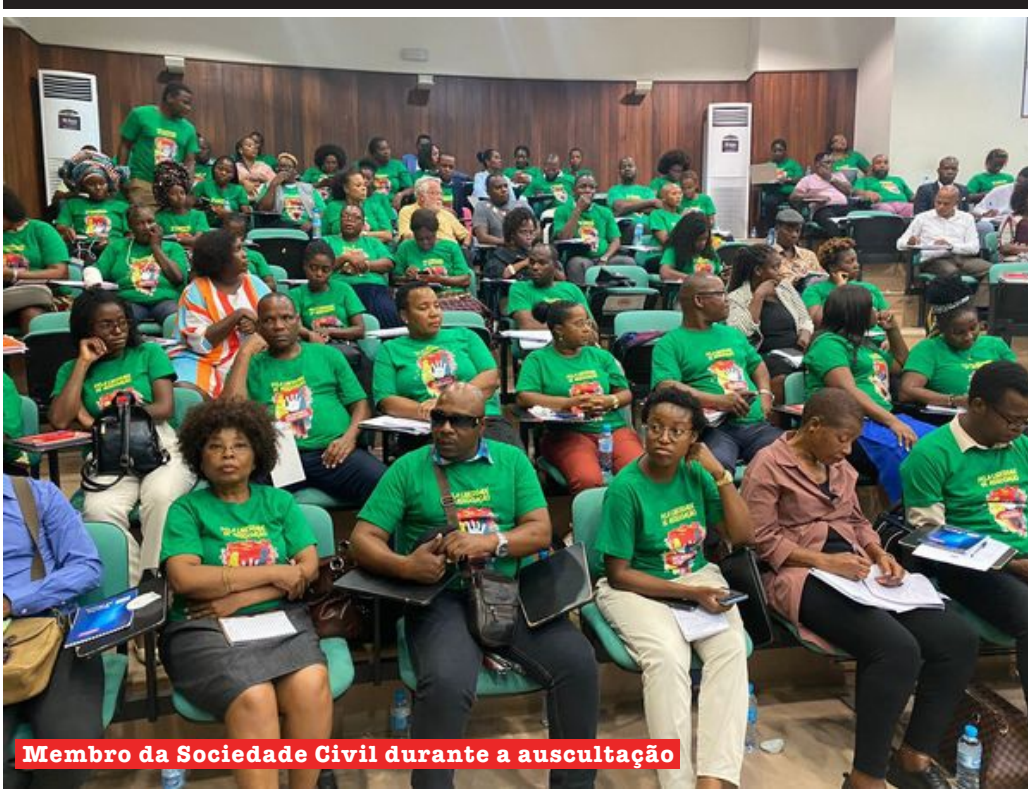
Membro da Sociedade Civil durante a auscultação