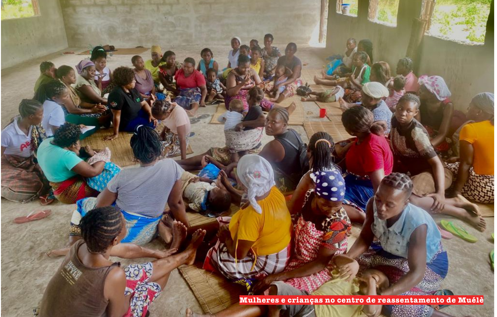
Mulheres e crianças no centro de reassentamento de Muélè

➔ O centro transitório “Múelè 3” é a nova morada para 189 crianças que viram as suas casas submersas na sequência das inundações e cheias que afectaram os bairros de Aeroporto, Chalambe, Tchemane e Chienguene.